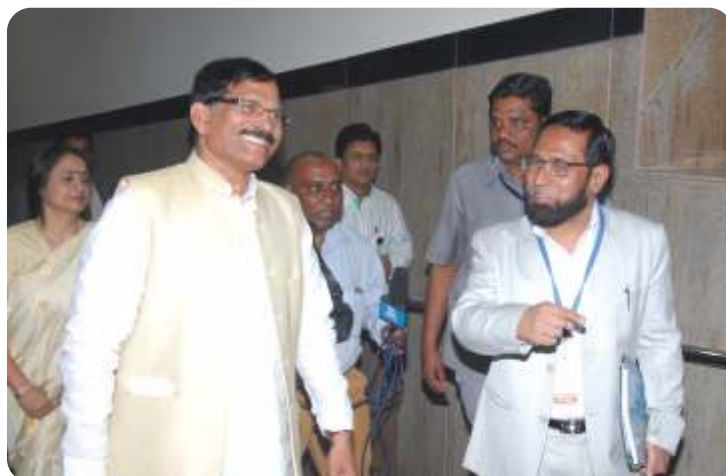
Director NIUM welcoming Hon'ble Minister of AYUSH Govt of India, Shri. Shripad Yesso Naik, to the Conference venue