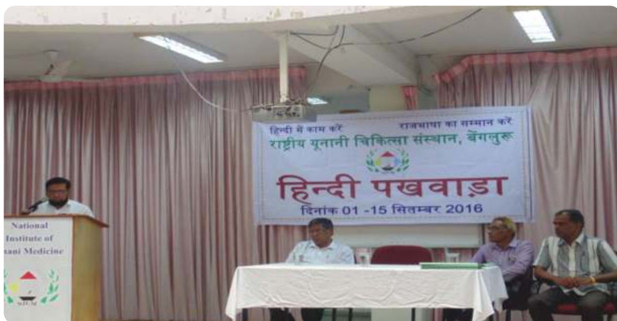
Director, NIUM addressing the NIUM Staff on the occasion of Hindi Pakhwada