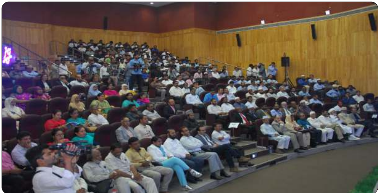
Delegates at the conference (ICUM-16)