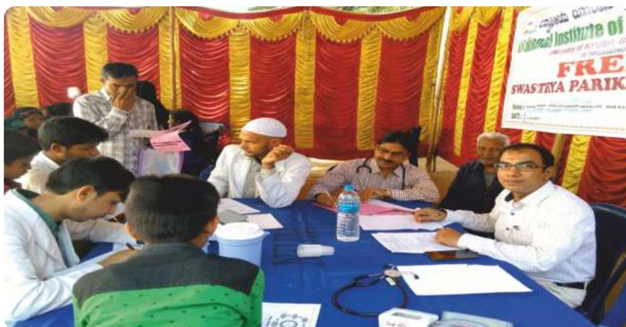
Doctors of the institute examining and prescribing medicines in a free Swasthya Parikshan Camp