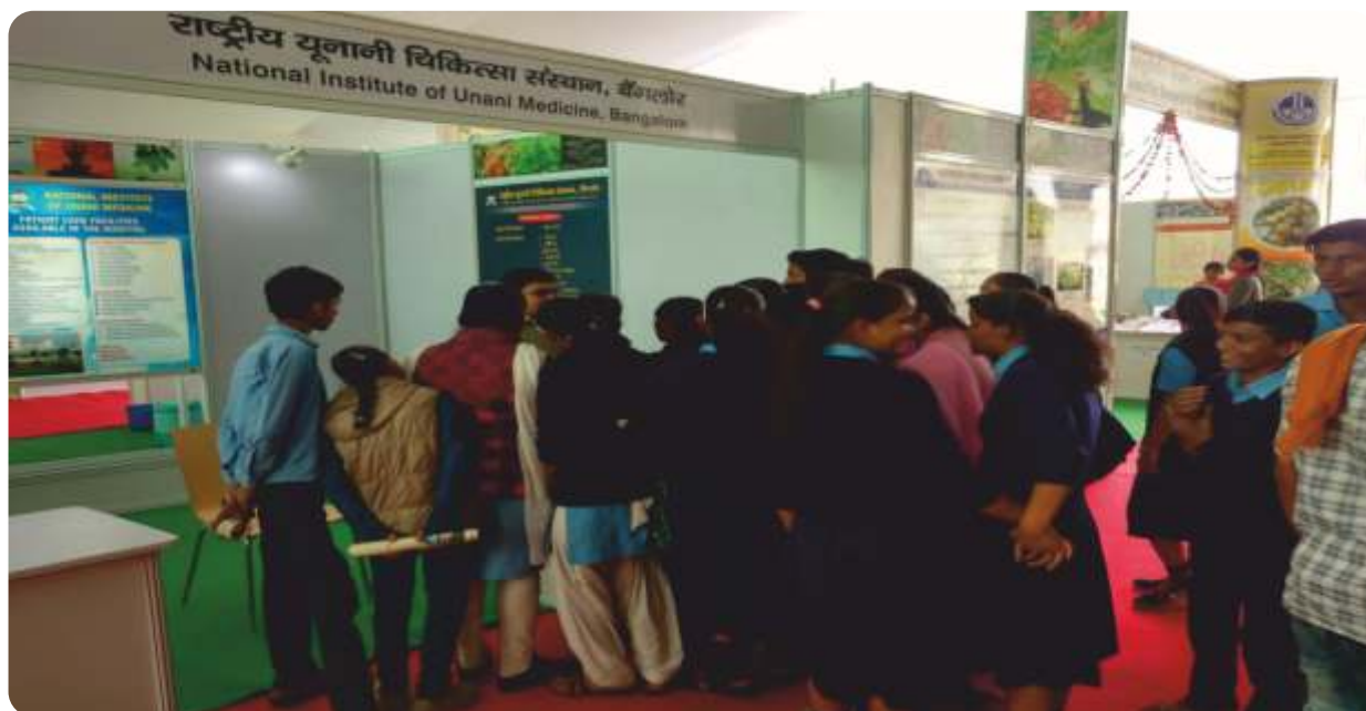
School Children at the NIUM Stall in AROGYA MELA at Bikaner, Rajasthan