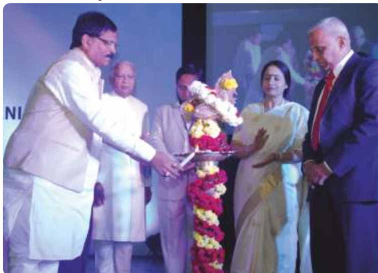
Candle lightening ceremony ICUM-16