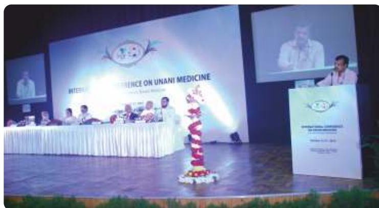
Shri Anurag Srivastava addressing the inaugural session-ICUM-16