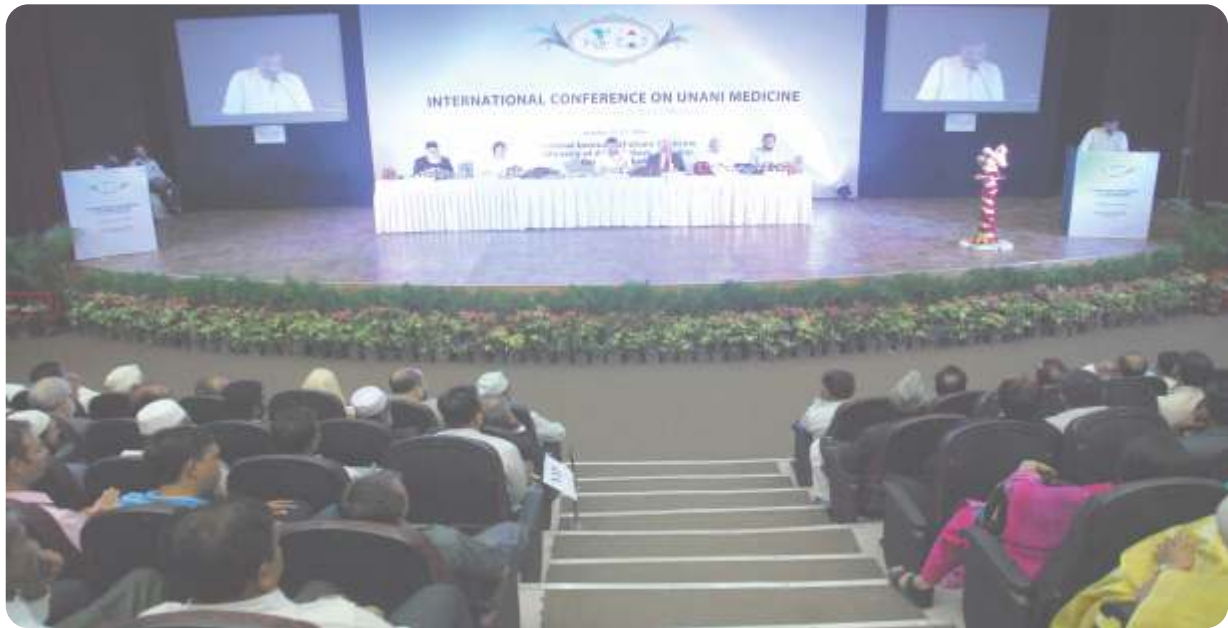
A view of ICUM-16 in progress