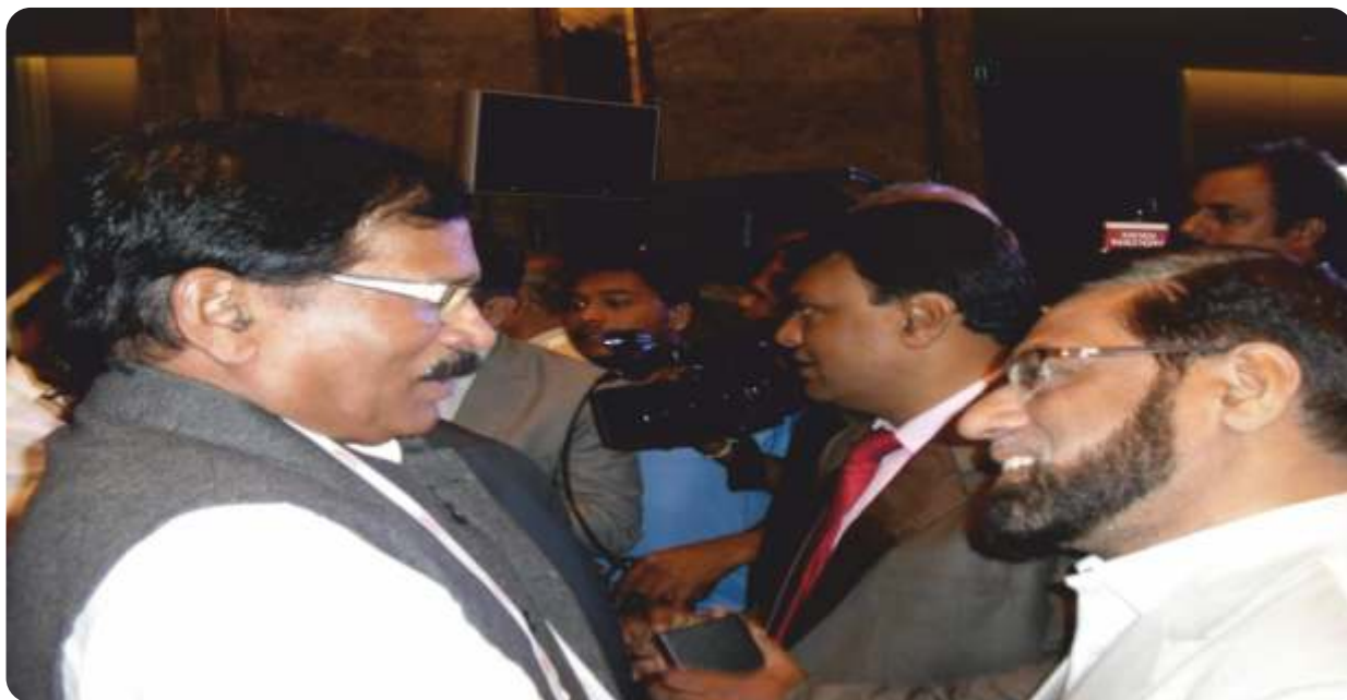
Hon'ble Minister of AYUSH Shri Shripad Yesso Naik with Director NIUM at BRICS Wellness Workshop