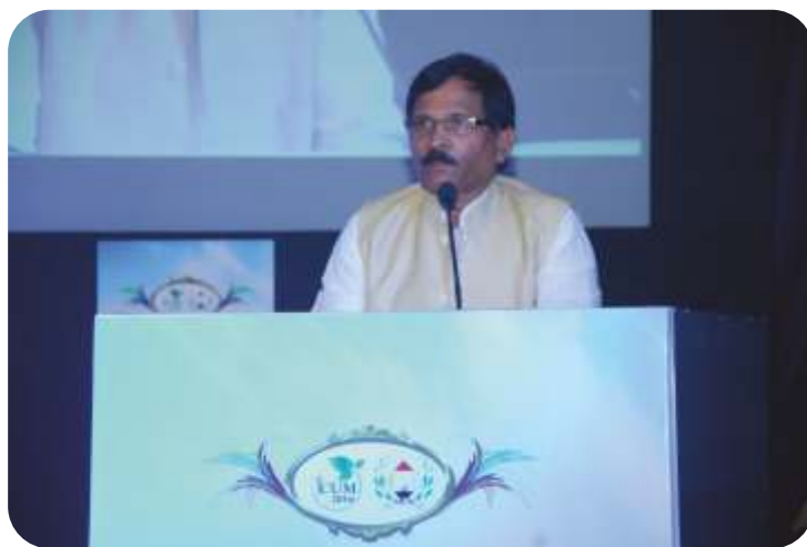
Hon'ble Minister of AYUSH, Govt. of India addressing in the Inaugural session